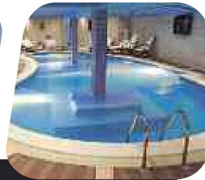
PE ORAZ PP